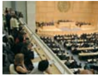
2006: Erste Sitzung des UNO-Menschenrechtsrats in Genf.