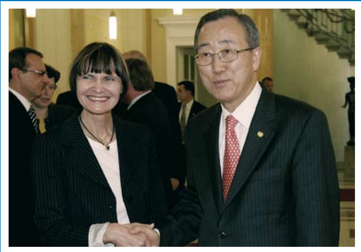
Bundespräsidentin Micheline Calmy-Rey trifft in Bern den neuen UNO-Generalsekretär Ban Ki-moon.

für friedenserhaltende Operationen, bekleidet und als Untergeneralsekretär sowie als Sonderbeauftragter von Generalsekretär Boutros Boutros-Ghali für das ehemalige Jugoslawien gewirkt. Am 1. Januar 1997 wurde er als erster UNO-Mitarbeiter und als erster Vertreter Schwarzafrikas zum siebten Generalsekretär der Vereinten Nationen ernannt. Im Laufe seiner Amtszeit hat Kofi Annan die Organisation geprägt wie kaum einer seiner Vorgänger zuvor und diese geradezu verkörpert. Der ihm und den Vereinten Nationen zu gleichen Teilen 2001 verliehene Friedensnobelpreis stellt die