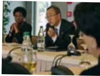
2007: UNO-Generalsekretär Ban Ki-moon präsidiert das Chief Executives Board (CEB) der UNO in Genf.