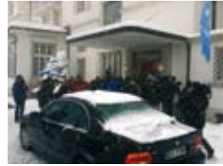
2004: Zyperngespräche auf dem Bürgerstock.