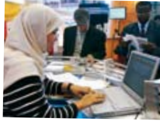
2003: Weltgipfel zur Informationsgesellschaft an der UNO in Genf.