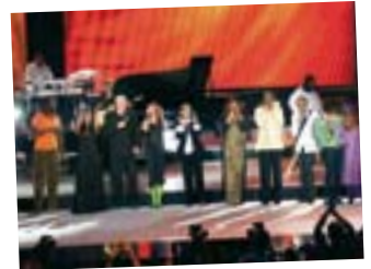
2005: Die Schweiz und die UNO organisieren in Genf das Konzert „United Against Malaria“, u.a. mit den Sängern Peter Gabriel und Youssou N'Dour.

elle Fragen und im Plenum von National- und Ständerat. Zudem haben die eidgenössischen Räte in jedem Jahr anlässlich der Vorlage des UNO-Berichts durch den Bundesrat Gelegenheit, sich zu den Prioritäten der Schweiz für die nächste Tagung der UNO-Generalversammlung zu äussern. Darüber hinaus machen die Mitglieder der eidgenössischen Räte begrüssenswerterweise Gebrauch von den ihnen zur Verfügung stehenden Instrumenten (Interpellationen, Anfragen, Motionen und Postulate), um zum Dialog mit dem Bundesrat über die Beziehungen der Schweiz zur UNO beizutragen. Die parlamentarischen Vorstösse befassten sich namentlich mit der Teilnahme der Schweiz an Friedenssicherungseinsätzen und mit der Höhe der Beiträge unseres Landes an die Vereinten Nationen.