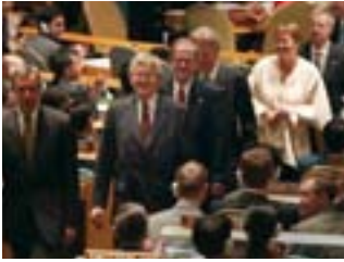
2002: Die Schweiz wird offiziell als UNO-Mitglied aufgenommen.