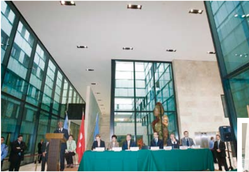
UNO-Generalsekretär Kofi Annan weiht im November 2006 den Neubau der Weltgesundheitsorganisation WHO und des Programms UNAIDS in Genf ein.