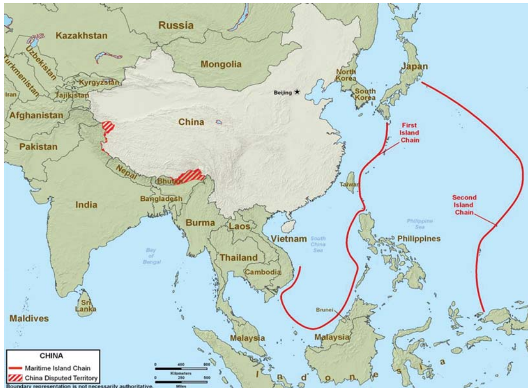
Abbildung. 6: Chinas erste und zweite maritime Verteidigungslinie