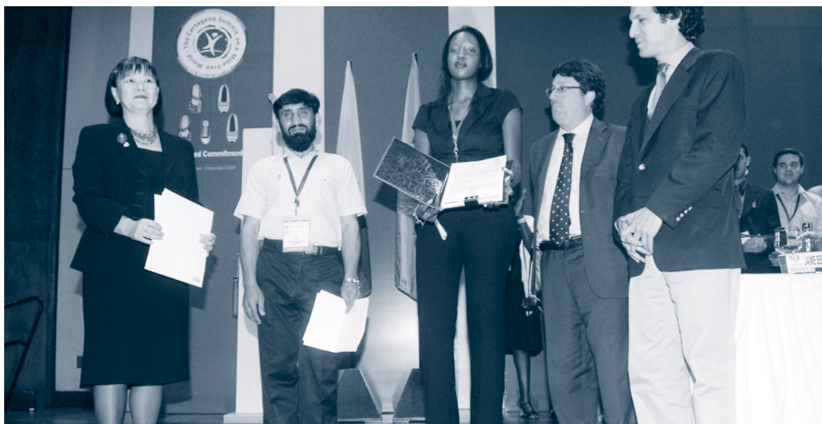
Cérémonie de remise de la déclaration de Carthagène | Carthagène, Colombie | 4 décembre 2009