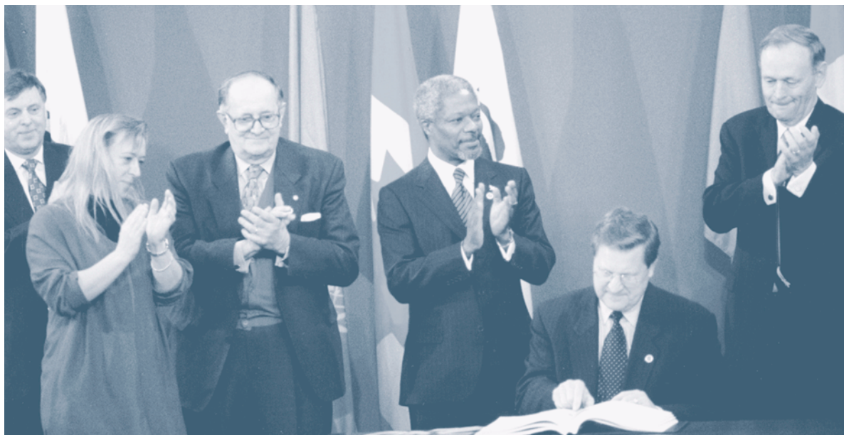
Cérémonie de signature de la Convention | Ottawa | 3 décembre 1997

Les besoins des victimes ont été pris en compte, pour la première fois dans le cadre d'une convention de désarmement/contrôle des armements. Beaucoup de ces États responsables d'un nombre significatif de victimes ont développé des objectifs et / ou un plan d'action pour répondre aux besoins des victimes de mines antipersonnel et autres personnes handicapées et garantir leurs droits.