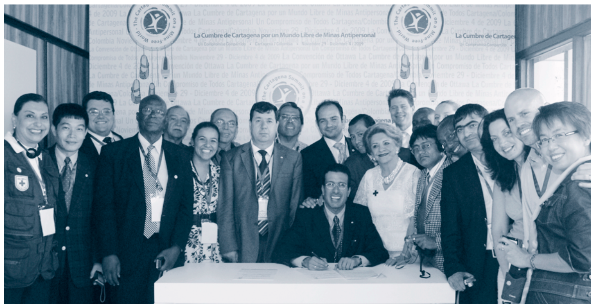
Délégués de la Fédération internationale des Sociétés de la Croix-Rouge et du Croissant-Rouge | Carthagène, Colombie | 4 décembre 2009