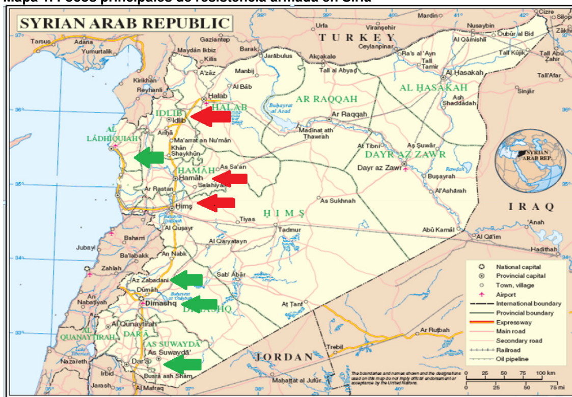
Mapa 1. Focos principales de resistencia armada en Siria

Fuente: elaboración propia sobre mapa de Naciones Unidas (focos principales en rojo y secundarios en verde).