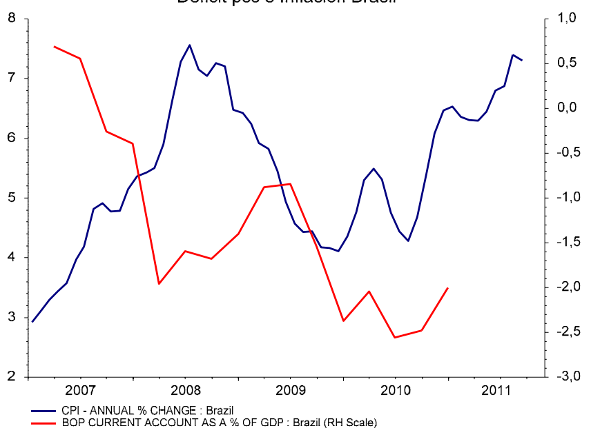
Gráfico 2. Déficit por cuenta corriente e inflación en Brasil Deficit pcc e Inflación Brasil

Tener un déficit exterior creciente incluso en un contexto de altos precios de los productos primarios (que suponen más del 40% de sus exportaciones) y de mejora de la relación real de intercambio resulta preocupante porque si la inflación y el déficit por cuenta corriente continúan creciendo, Brasil podría verse sorprendido por un súbito cambio de expectativas y salida de capitales, que podría dar lugar a una crisis financiera como las que los países emergentes ya sufrieron en los años 90.