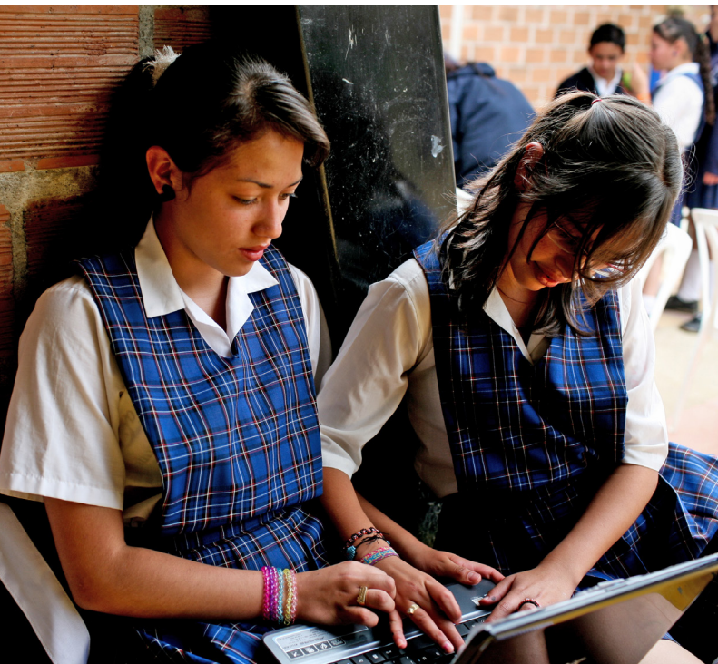
El acceso a la educación ha aumentado, pero la calidad de la misma es preocupante. Aquí, estudiantes en una secundaria rural en el departamento de Antioquia.

Se necesitó de una iniciativa política y social de gran magnitud para extender las mejoras sociales que son cruciales en el milagro colombiano. Actualmente, el país es líder en mejoras de acceso a servicios públicos básicos y de salud, en reducción de los niveles de pobreza, en el aumento de inversión en infraestructura y en la atracción de inversión extranjera directa.