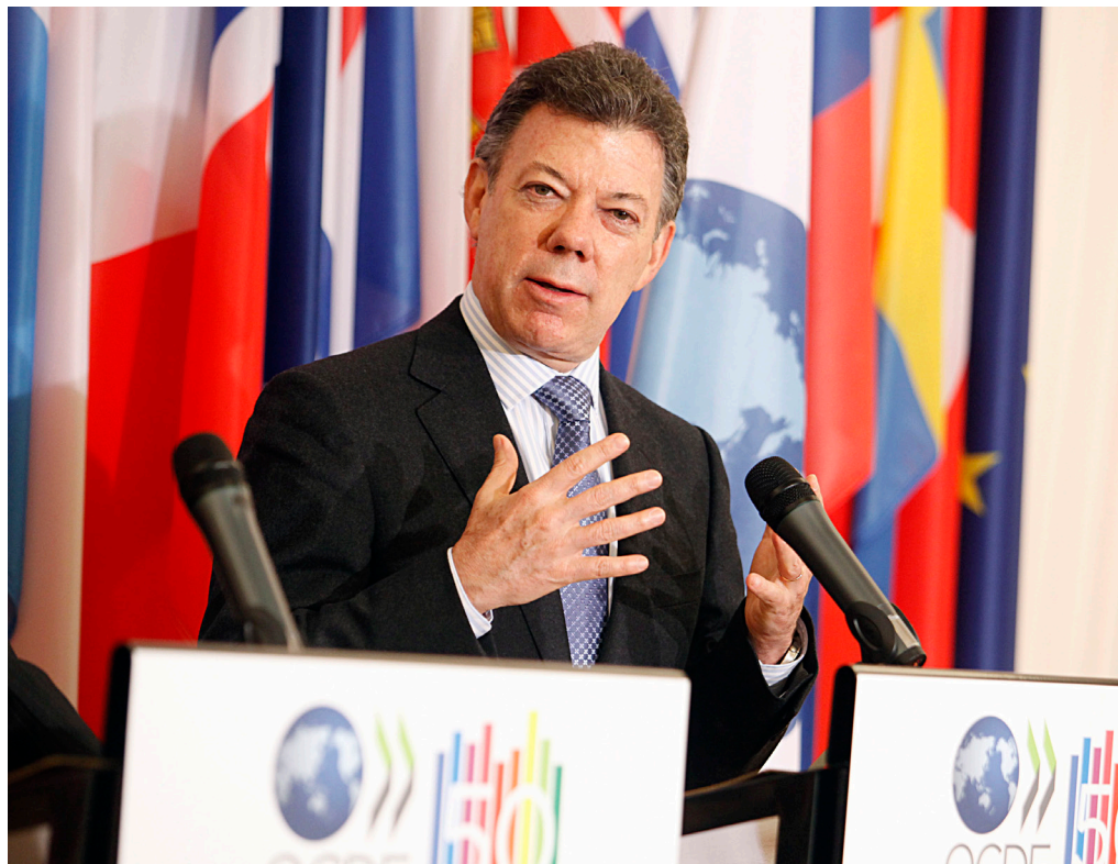
Bienvenidos al club? El Presidente Juan Manuel Santos se dirige a una Conferencia de la OCDE en París, Francia.

Los avances sociales también se pueden ver en la sociedad colombiana. Aquellos que antes no