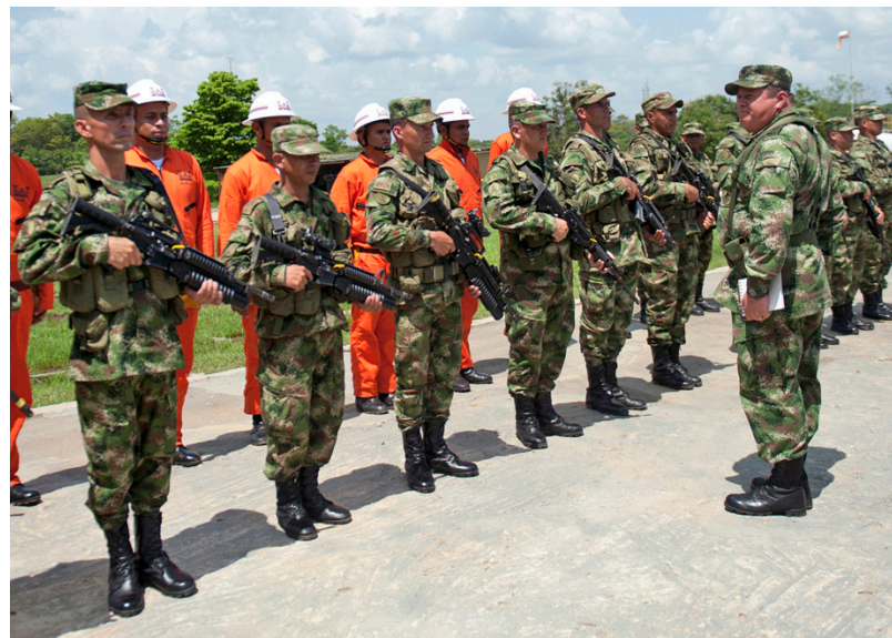
A las Fuerzas Armadas se les reconoce el rol principal que jugaron en las mejoras de seguridad del país.

La guerra contra las drogas consumió al país al tiempo que surgieron una gran cantidad de grupos paramilitares de derecha. La inseguridad envolvió a Colombia; los grupos paramilitares y los guerrilleros debilitaron el estado de derecho y realizaron incontables crímenes de guerra y violaciones a los derechos humanos. 11 Al final de la década de los noventa y a comienzos del 2000, Colombia ocupaba muchos puestos indeseados de liderazgo mundial: poseía el índice mundial más alto de secuestros y ocupaba el primer puesto en la exportación de cocaína. 12 En cinco años, el área de los campos cultivados de coca aumentó en un 74 por ciento. 13 En el 2002, Colombia se convirtió en la capital mundial de homicidios, con 70 homicidios por cada 100.000 habitantes. 14 Además de esto, seis millones