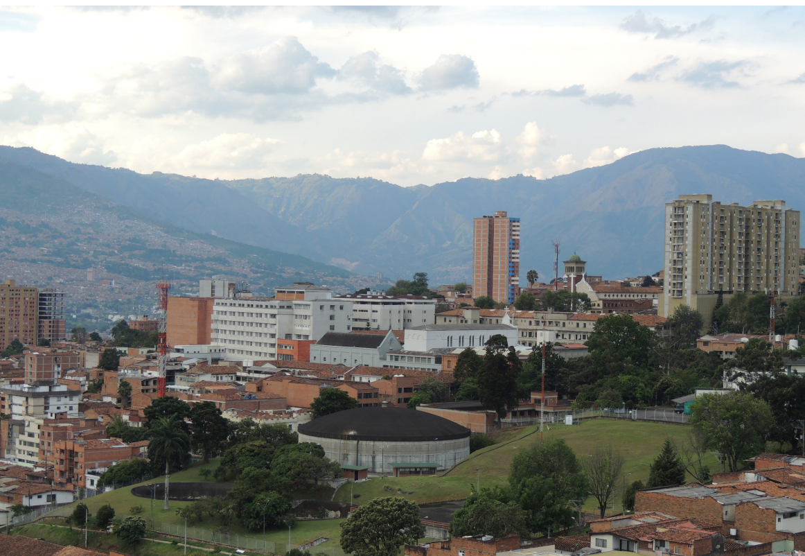
Una nueva imagen. Medellín, antes conocida por sus niveles de criminalidad, ahora es asociada con innovación.

actualmente está en su última fase. Los temas a discutir ya no son los de reformas agrarias, víctimas y narcotráfico. Las dos partes en la mesa han hecho lo que muchos creían imposible: acordar mecanismos de justicia transicional. La lista de puntos pendientes incluye los términos de dejación de armas, mecanismos para implementar y verificar el acuerdo general, una fecha para el cese final y bilateral del fuego y el método para conseguir la aprobación ciudadana.