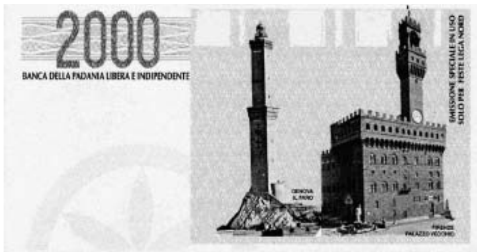
Деньги несуществующей «Паданской республики»

редаче регионам основных функций законодательной власти, в развитии местного самоуправления, лишившего центральные власти важных государственных рычагов. Однако две трети участников референдума отвергли новацию, нанеся удар по «ползучему сепаратизму». Хотя и здесь еще рано ставить точку.