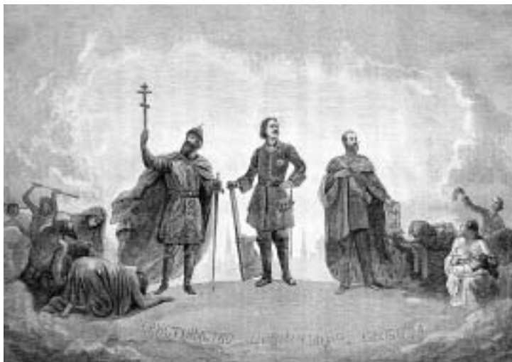
Русские ценности – христианство, цивилизация и свобода, которые олицетворяют три властителя: князь Владимир, Петр I и Александр II Журнал «Нива», 1899 г.

“Разрыв между Востоком и Западом – отчасти продукт несовместимых мировоззрений, относящихся к разным историческим эпохам. В то время как Европа становится все более светской, значение религии в мусульманском мире неуклонно растет. В случае с США разница не столь велика: американцы глубоко набожны и недавно пережили религиозное возрождение”