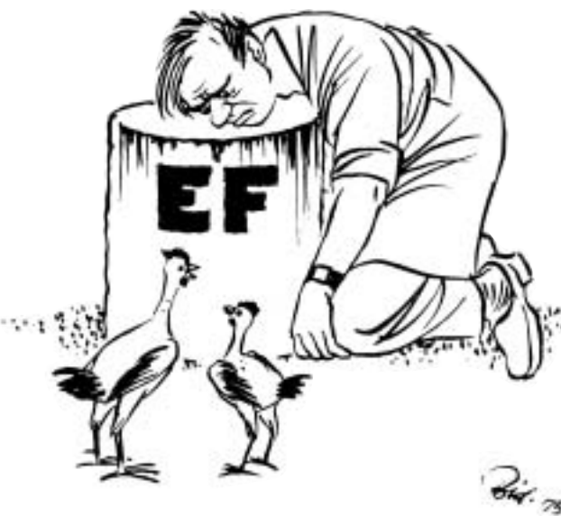
Дания жертвует суверенитетом в пользу ЕЭС. Херлуф Бидstrup, 1975 г.

— Лично я вижу только три глобальные цели. Первая состоит в том, чтобы всячески поддерживать мир и согласие между народами. Вторая — сделать все возможное для развития взаимной европейской солидарности, которая должна помочь выровнять уровни раз-