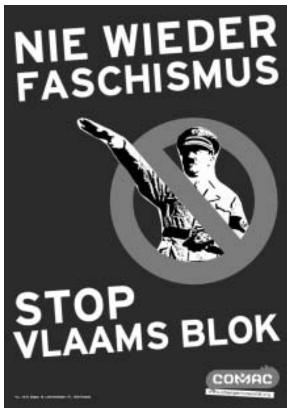
«Фашизм не пройдет! Остановим Фламандский блок.»

Отметим, что бельгийская юстиция, формально разрушив бастион радикал-сепаратизма, не смогла воспрепятствовать его благополучному возвращению с появлением партии Фламандский интерес, приверженной той же риторике и возглавляемой теми же лидерами. В результате бельгийское общество подвергается постоянному идеологическому воздействию ксенофобов-сепаратистов и внутренне готово к дальнейшей дезинтеграции государства. Последним свидетельством тому — появившийся в конце 2006-го на одном из каналов бельгийского телевидения сюжет о якобы уже свершившемся распаде Бельгии. В эту «утку» поверили не только многие из простых граждан, но и некоторые представители бельгийского истеблишмента. Есть ли доля истины в такой злой шутке, пока определить трудно.