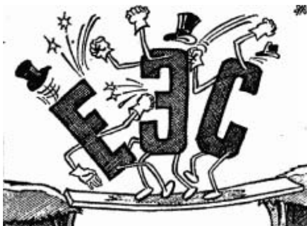
Переговоры в «Общем рынке», 1980-е гг.

— Корни и менталитет этих двух этносов действительно различны. Но даже про китайцев вы не можете сказать: вот, мол, мы их пустим во Францию, и через некоторое время они непременно превратятся в идеальных французских граждан. Это тем более трудно сделать по отношению к некоторым мусульманам. Такого рода упрощенные воззрения встречаются у ряда политиков, по милости которых в обществе складывается иллюзорное впечатление, будто существует некая машина по формированию законопослушных граждан. Как, например, машина по изготовлению колбас: на одном конце фарш, а на другом — уже сосиски. Но в реальности все гораздо сложнее. И этот факт нужно осознать и принять.