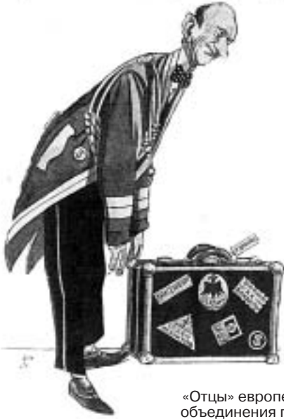
«Отцы» европейского объединения глазами советской пропаганды: Робер Шуман...

сентябре 1949-го Федеративной Республики Германия.