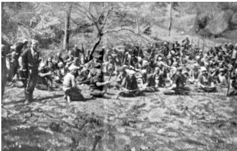
Отряд албанских повстанцев

и Грецией, и что нужно защищать свои поля, избы и стада. Обманутые надежды – как? из наших ружей, на наши деньги, да против нас же? – крайне ожесточили нашу армию. Отсюда, главным образом, и пошли, жестокости. Но о жестокостях позже... <...>