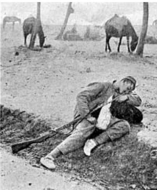
Черногорский солдат, свалившийся от усталости на дороге

Пленные, оторванные от своих, очень жалки. Не раз бывало, что приведенный моими солдатами арнаут падал на землю, униженно извивался и жалобно молил: «Аман, аман»... Я строго запрещал убивать их, но скажу прямо: не помогало. Прикажешь отвести пленника к командиру, солдат отведет его шагов на пятьдесят, потом слышишь выстрел. Дело сделано. Откуда такая жестокость? Я сперва думал, что солдаты-крестьяне лелеют мысль переселиться на новые земли и заблаговременно стремятся очистить их от старых хозяев. Нарочито заговаривал с ними: вот, мол, теперь