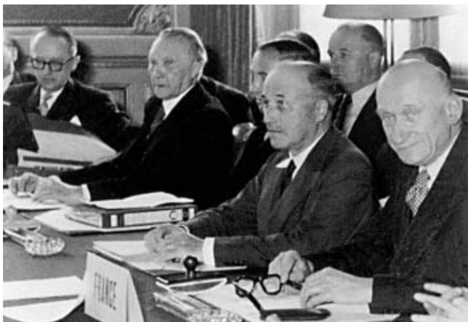
«Отцы» интеграции – Вальтер Хальштайн, Конрад Аденауэр, Жан Монн е, Робер Шуман

него рынка (1985–1992) и создания ЭВС (1992–1999), – публично заявил, что ЕС переживает самый тяжелый кризис в своей истории, потерял ориентацию и не имеет общего видения единой Европы.