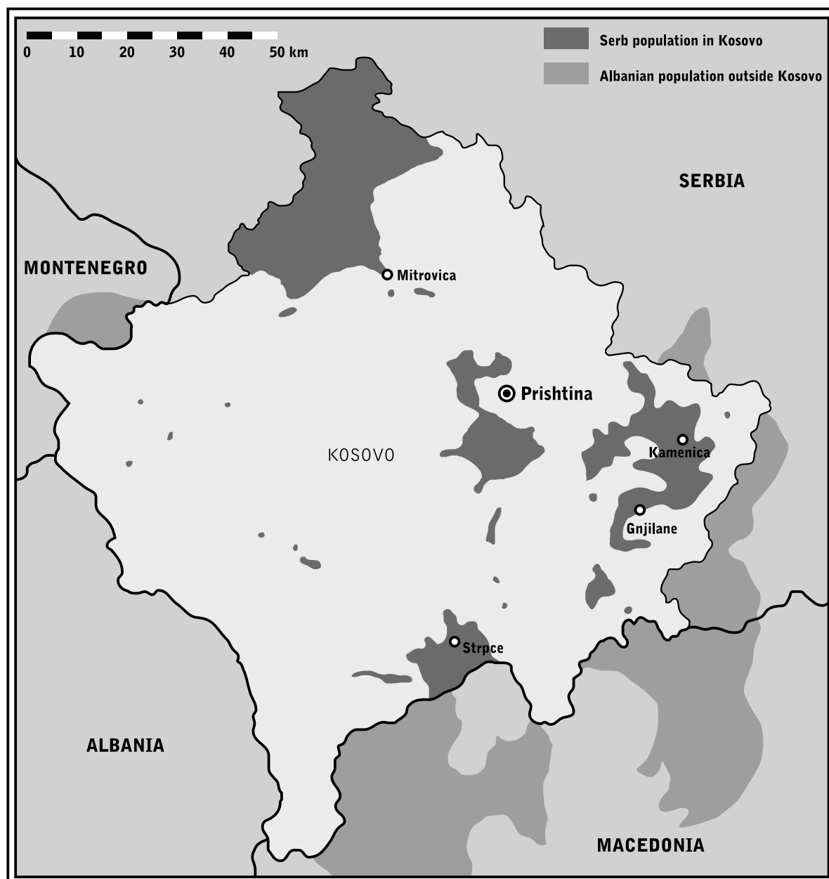
Map 1. Serb population in Kosovo and Albanian population outside Kosovo

tive trend, however, was undermined in March 2004 when the anti-Serb riots broke out.