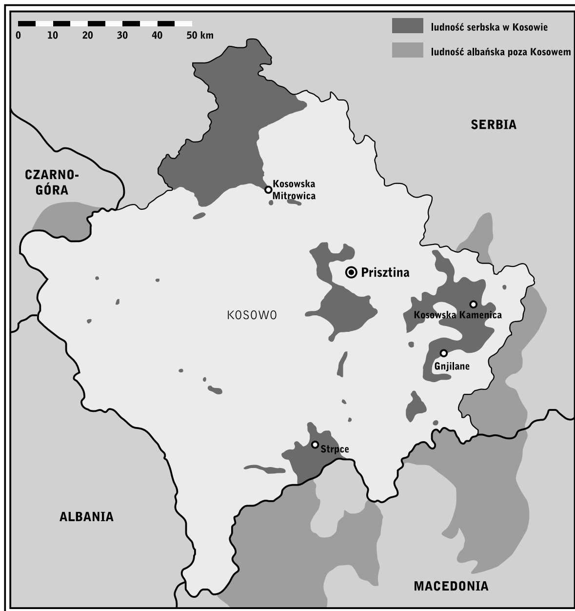
Mapa 1. Ludność serbska w Kosowie i ludność albańska poza Kosowem

16 marca 2004 roku plotka o utonięciu trzech albańskich dzieci w rzece Ibar w pobliżu Mitrowicy uciekających przed Serbami oraz zablokowanie przez Serbów ze wsi Czaglatica po zranieniu ich rodaka strategicznej drogi położonej na południe od Prisztiny wywołały poważne albańskie zamieszki, w których wzięło udział około 50 tys. osób (2,5% całej populacji albańskiej). Albańczycy zaatakowali serbskie enklawy, których musiały bronić siły międzynarodowe. Najbardziej zacięte walki toczyły się w Mitrowicy i Czaglaticy. W trakcie zamieszek zginęło 20 osób (11 Albańczyków i 9 Serbów), ponad 4 tys. Serbów i Romów zostało wypędzonych. Obiektem ataków stały się