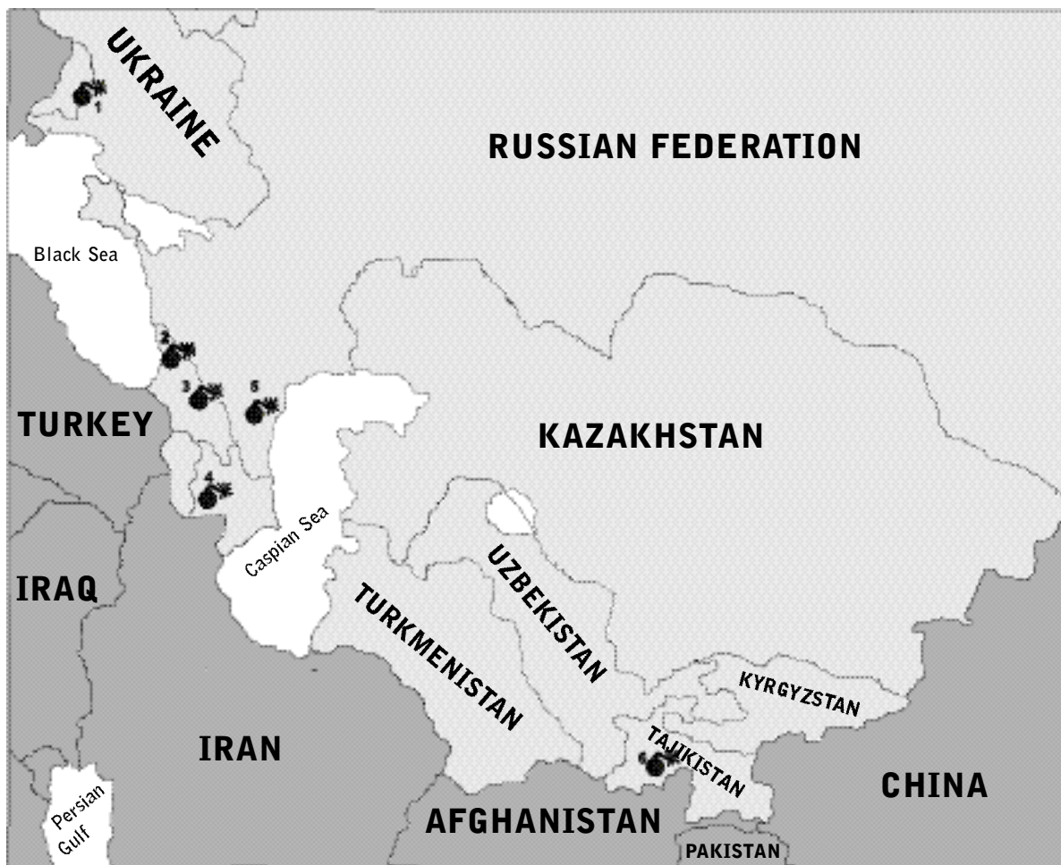
Map 1. Major armed conflicts in the post-Soviet area