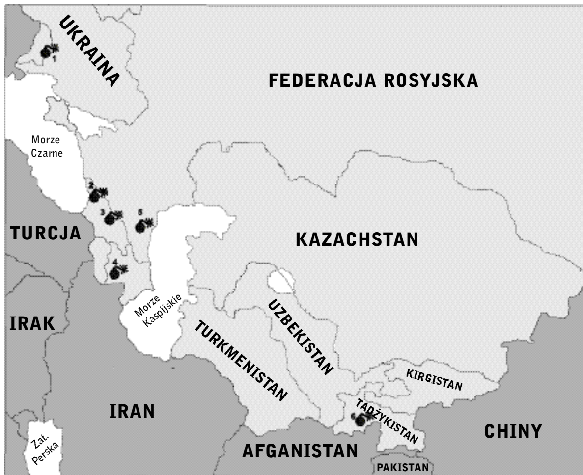
Mapa 1. Ważniejsze konflikty zbrojne na obszarze postradzieckim